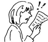
Ich ärgere mich über meine Note.