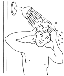
Er wäscht sich die Haare.