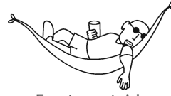
Er entspannt sich.