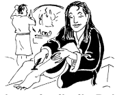
Rasierst du dir die Beine?