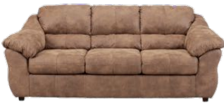
das Sofa / die Couch