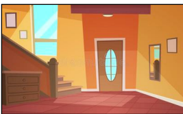
der Eingang / die Diele