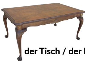
der Tisch / der Esstisch