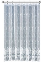
die Gardine / der Vorhang