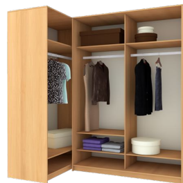
der Kleiderschrank / die Garderobe