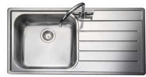
das Spülbecken / die Spüle