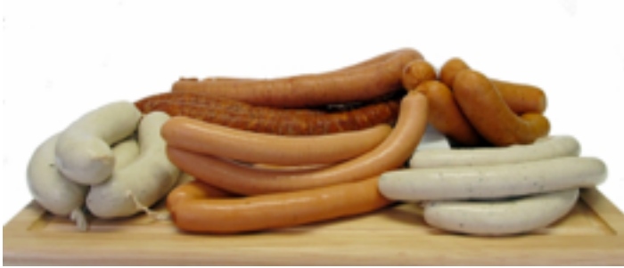
Weißwurst, Bockwurst ...