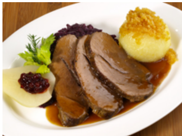
Wildgerichte: Hirsch, Reh