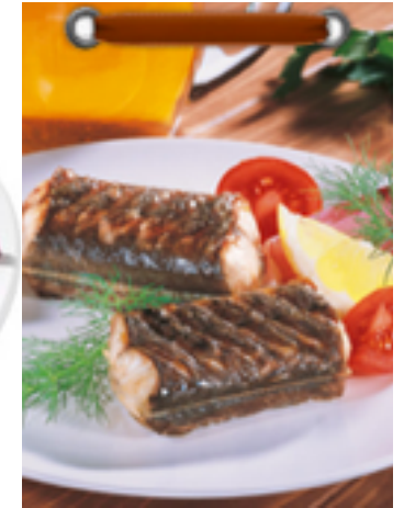
Aal ( eel )