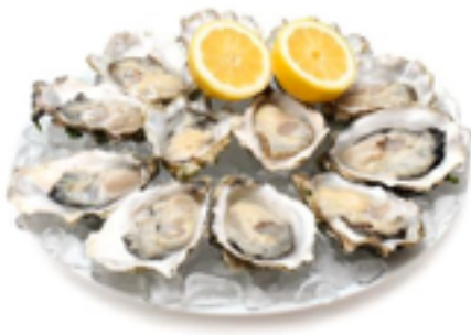
Austern ( oysters )