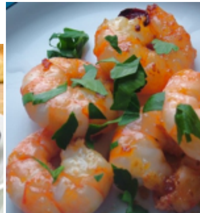
Garnele / Krabbe ( shrimp )