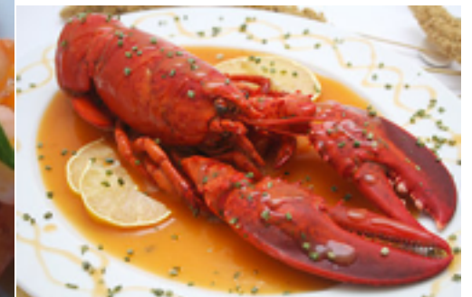
Hummer ( lobster )