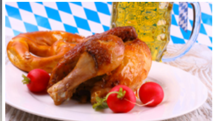
Hähnchen / Hendl