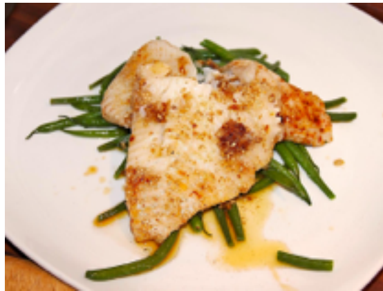
Heilbutt ( halibut )