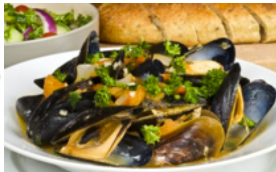
Muscheln ( mussels )