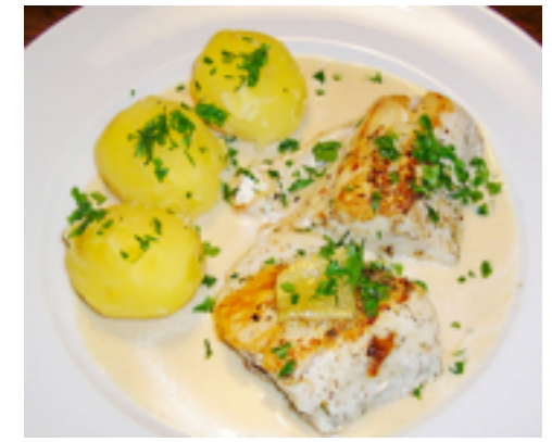
Zander ( perch/walleye )