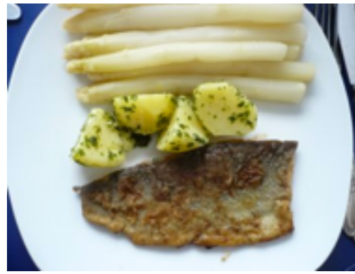
Forelle ( trout )