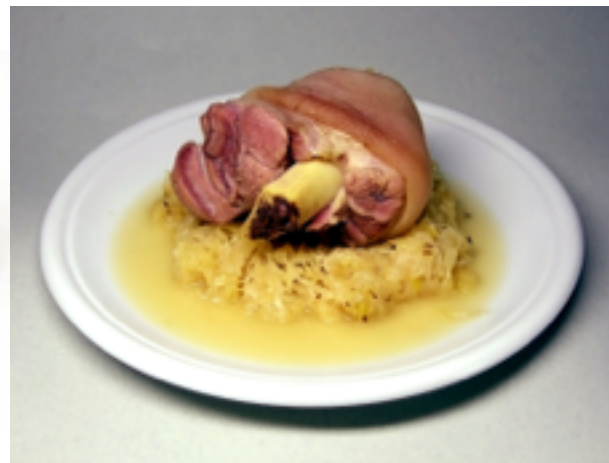
Schweinshaxe / Eisbein