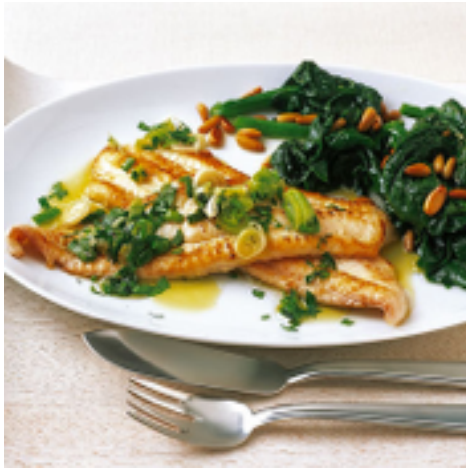
Seezunge ( sole )