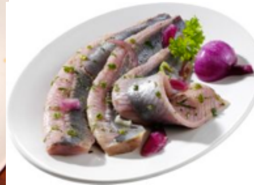
Matjes / Hering ( herring )