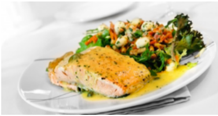
Lachs ( salmon )