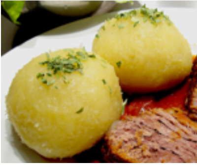
Knödel / Klöße