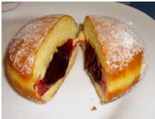
Berliner / Krapfen